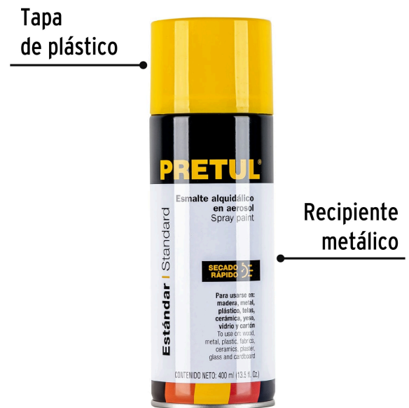
Tapa de plástico

Color aproximado. El tono puede variar de acuerdo a la superficie de aplicación