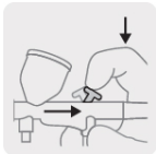
Control de aire y flujo de pintura