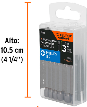
Alto: 10.5 cm (4 1/4")