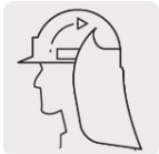
Fijación hook and loop