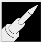
Punta cónica fina