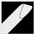
Punta en "V"