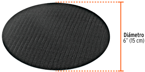
Diámetro 6" (15 cm)

Para lijadora neumática TPN-861-2, Truper