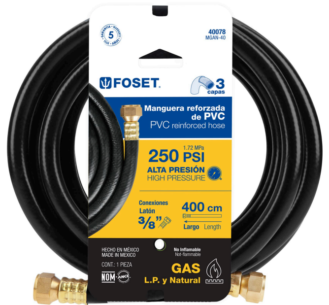
Tuerca 3/8" FLARE de latón