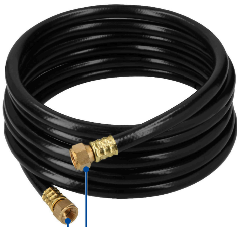
Tuerca 3/8" FLARE de latón