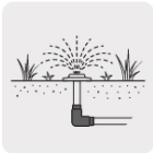
Para sistemas de riego y jardín