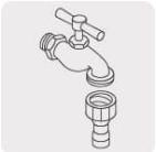
Laves de jardín