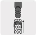
Para manguera rígida