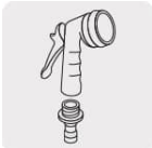
Pistolas para riego