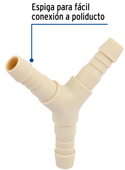
Espiga para fácil conexión a poliducto