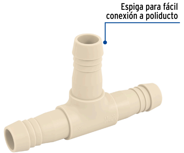
Espiga para fácil conexión a poliducto