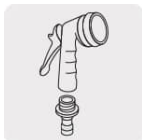
Pistolas para riego