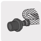
Para manguera flexible