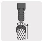
Para manguera rígida