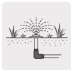
Para sistemas de riego y jardín