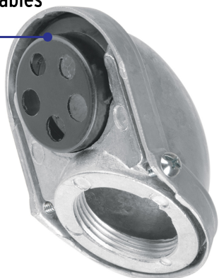
Cuerpo de aluminio