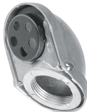
Entrada 1 1/4" (32 mm)