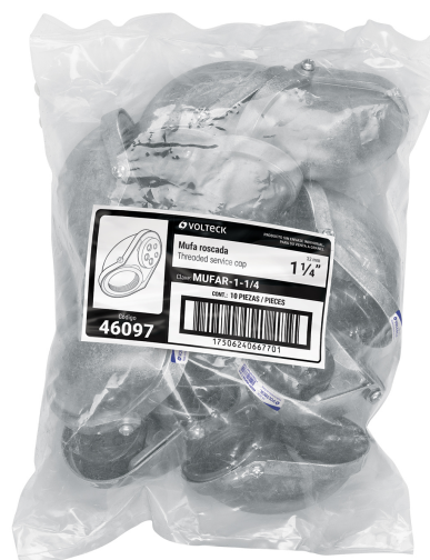
Tubo conduit galvanizado, para mufa 1 1/4"