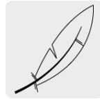
Pluma y plumón de ganso