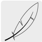
Pluma y plumón de ganso