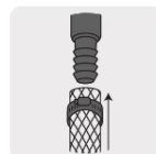
Para manguera rígida