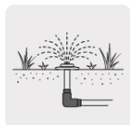
Para sistemas de riego y jardín