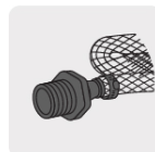
Para manguera flexible