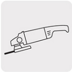
Para esmeriladora angular