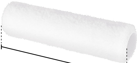
Largo 9" (23 cm)