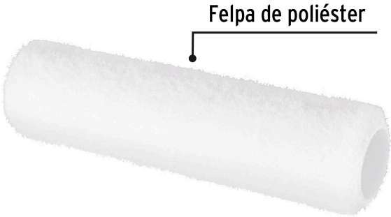
Felpa de poliéster