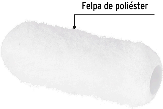
Felpa de poliéster