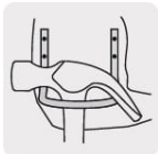
Gancho de acero para martillo