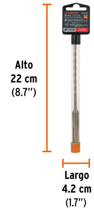
Peso: 0.04 kg (0.09 lb)