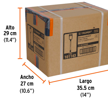
Contiene: 30 inner (150 piezas)