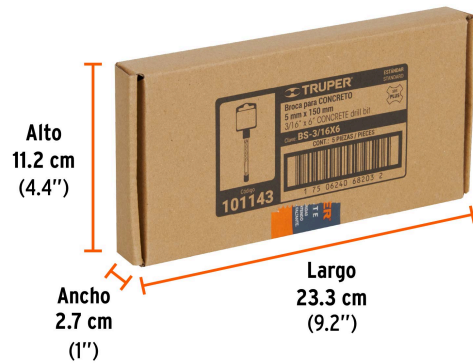
Contiene: 5 piezas