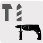
Para rotomartillos SDS Plus