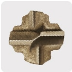
Punta de cruz