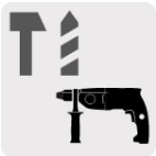
Para rotomartillos SDS Plus