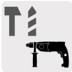
Para rotomartillos SDS Plus