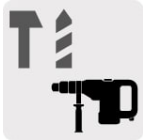
Para rotomartillos SDS Max