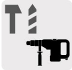
Para rotomartillos SDS Max