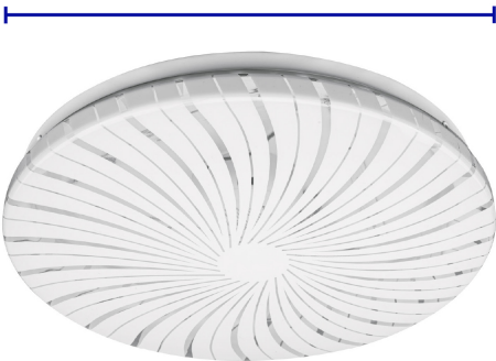
Diámetro 25 cm