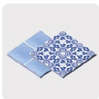
Loseta y cerámica