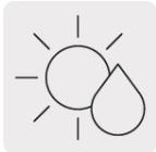
Para cortes en seco y húmedo