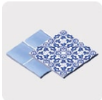
Loseta y cerámica