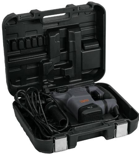
Incluye estuche plástico