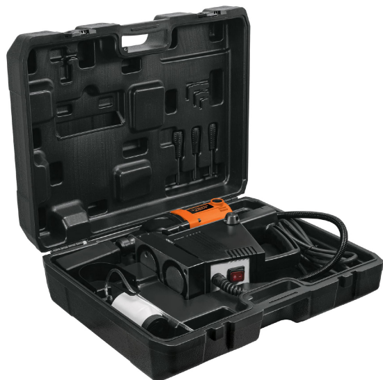
Incluye estuche plástico