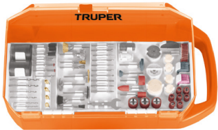
Estuche organizador que facilita el almacenamiento de los accesorios