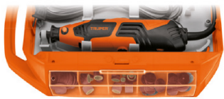
Compartimento posterior para herramienta y compartimentos laterales para accesorios