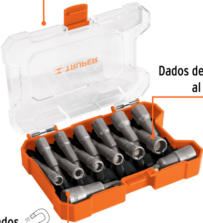
Dados de acero al cromo