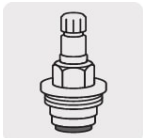
Cartucho de compresión (CARCO-1)