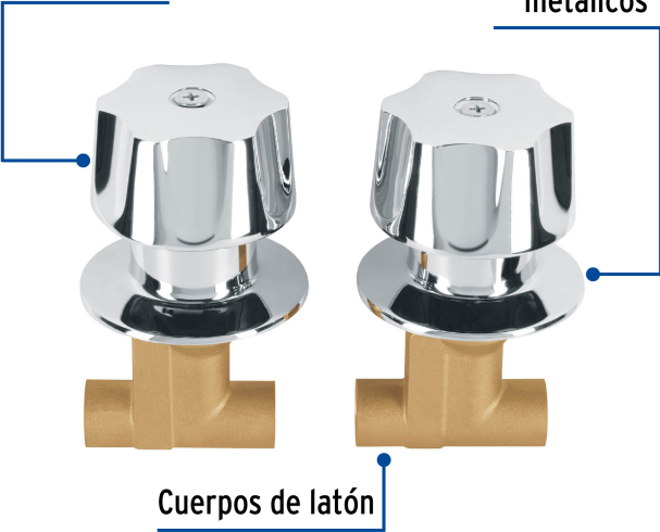
Cuerpos de latón