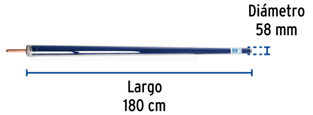
Diámetro 58 mm