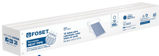
Caja 12 Tubos al vacío