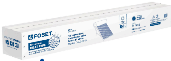
Caja 12 Tubos al vacío