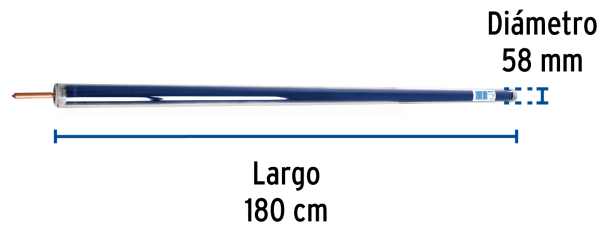
Diámetro 58 mm