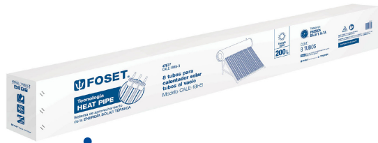
Caja 8 Tubos al vacío