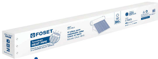
Caja 8 Tubos al vacío