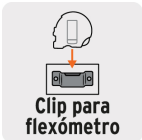
Clip para flexómetro