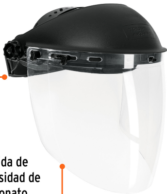
Mica rígida de alta densidad de policarbonato, antirrayadura