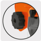
Perilla para ajuste