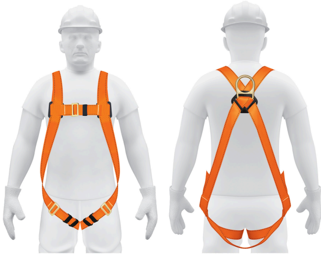
Anillo "D" de acero forjado