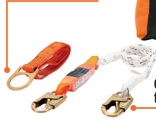
Ganchos robustos de acero forjado 10x más resistentes