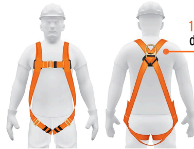
1 Anillo "D" de acero forjado