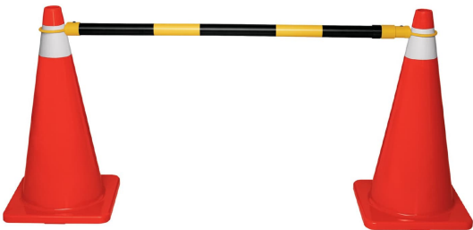
Permite delimitar o formar barreras de seguridad