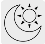
Uso de día y de noche