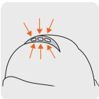
Ranuras de ventilación en la parte superior del casco