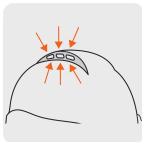
Ranuras de ventilación en la parte superior del casco