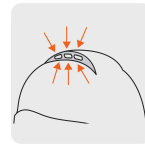
Ranuras de ventilación en la parte superior del casco