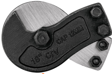
Cuchillas de acero al cromo vanadio en forma de gancho