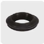
Empaque cónico antifuga