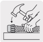
Fácil de instalar