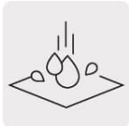
Resistente al agua