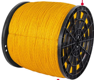
Fabricada en polipropileno